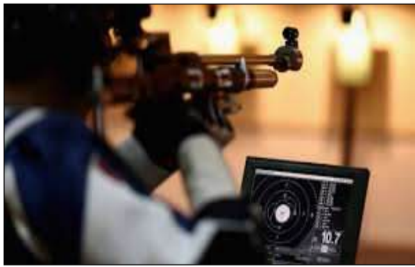
राइफल प्रोन वर्गों में पुरुष एवं महिला निशानेबाज भाग लेंगे। वहीं

एजेंसी नई दिल्ली। राष्ट्रीय राइफल संघ भारत (एनआरएफ) ने जर्मनी के सुहल में आयोजित होने वाली आईएसएसएफ जूनियर विश्व चैंपियनशिप 2026 के लिए भारतीय दल की घोषणा कर दी है। 16 से 26 जून तक चलने वाली इस प्रतिष्ठित प्रतियोगिता में भारत के 84 युवा निशानेबाज विभिन्न स्पर्धाओं में देश का प्रतिनिधित्व करेंगे। विश्व चैंपियनशिप में भारतीय दल राइफल, पिस्टल और शॉटगन वर्गों में चुनौती पेश करेगा। प्रतियोगिता युवा खिलाड़ियों के लिए अंतरराष्ट्रीय स्तर पर अपनी प्रतिभा साबित करने का बड़ा मंच मानी जाती है। राइफल स्पर्धाओं में 10 मीटर एयर राइफल, 50 मीटर राइफल थी पोजीशन और 50 मीटर पिस्टल वर्ग में 10 मीटर एयर पिस्टल, 25 मीटर रैपिड फायर