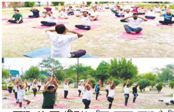
कटुआ, 16 जून (हि.स.)। अंतरराष्ट्रीय योग दिवस 2026 से पूर्व आयोजित गतिविधियों के क्रम में

जिला प्रशासन कटुआ ने जिला आयुष कार्यालय के सहयोग से ड्रीम लैंड पार्क कटुआ में जागरूकता सह