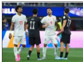
लेकिन कोई सफलता नहीं मिली और मुकाबला 2-2 की बराबरी पर समाप्त हुआ।इस परिणाम के बाद ग्रुप-जी पूरी तरह खुला हुआ नजर आ रहा है। शुरुआती दौर के बाद ईरान, न्यूजीलैंड, बेल्जियम और मिक्स सभी समान अंकों के साथ आगे बढ़ रहे हैं।