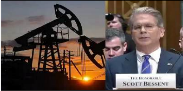
लगाभ 14 करोड़ बैरल तेल की तेजी से आगूना। इससे दुनियाभर में ऊर्जा की उपलब्धता बढ़ेगी और सप्लाय पर जो अस्थायी दबाव बना है, उसे कम करने में मदद मिलेगी।

दाम को काबू में रखने के लिए ऐसा किया गया है। अमेरिका-इजराइल की ईरान के साथ चल रही जंग की वजह से क्रूड की कीमतें 110 डॉलर प्रति बैरल के पार निकल गई हैं। उल्लेखनीय है कि 28 फरवरी को जंग शुरू होने से पहले ये 70 डॉलर के करीब थी। स्कॉट बेसेंट ने जारी एक