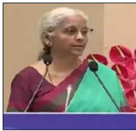
आयकर अधिकारियों को कहा, 'टैक्स देने वाला आपका विरोधी नहीं, बल्कि राष्ट्र निर्माण में भागीदार है।' उन्होंने इनकम टैक्स अधिकारियों से ज्यादा सहयोगात्मक सोच अपनाने का आग्रह किया।

एजेंसी नई दिल्ली। केंद्रीय वित्त मंत्री जयंत प्रकाश मंडाकर ने कहा कि नया आयकर कानून मुकदमों को कम करेगा और अनुपालन को सरल बनाएगा। उन्होंने कहा कि नया आयकर अधिनियम मुकदमों को काफी हद तक कम करने और अनुपालन को सरल बनाने का प्रयास करता है; उन्होंने सरल अधिकारियों से आग्रह किया कि वे करदाताओं को विरोधी मानने के बजाय राष्ट्र निर्माण में भागीदार के रूप में देखें। आयकर अधिनियम, 2025 पर राष्ट्रव्यापी जागरूकता अभियान' शुरू करते हुए वित्त मंत्री ने इनकम टैक्स वेबसाइट 2.0 को भी लॉन्च किया।